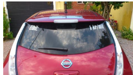
Leaf 1.0 2013-2016 Leaf 2.0 2018-