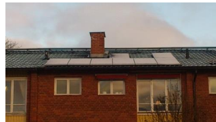
2,5 kW 2000 kWh/år