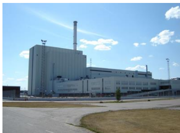
Forsmark 3 (1990-2000)