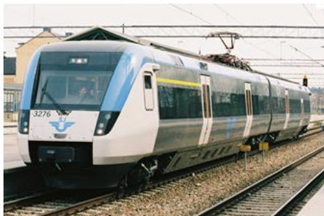
2000-2004 Bombardier Transportation